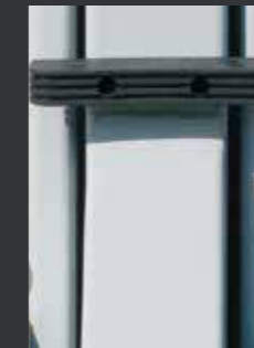
06 设置车门挡，保护车门免受损坏。