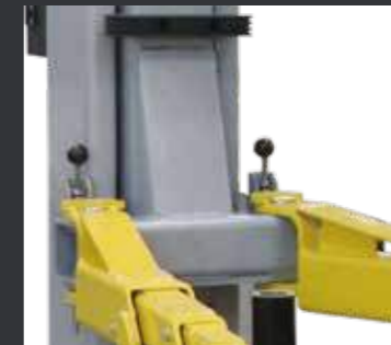
02 工作时摇臂会自动锁止，下降到最低时会自动解锁。