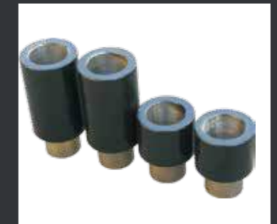
03 标配的两种加高接头套。