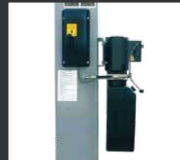
01 单侧手动机械解锁，操作方便可靠。