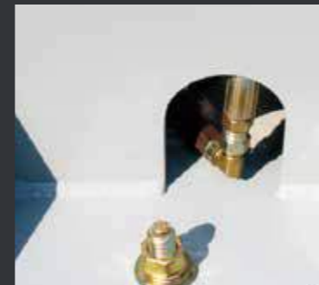
04 双油缸均设置节流阀，避免油管万一爆裂产生的危险。