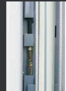
05 钢丝绳及胶管均内置于立柱内，更美观整洁。