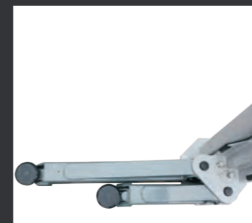
04 前摇臂可以180度旋转, 增加了顶车区域, 轻松举升长、短轴距汽车。