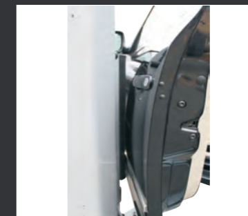
02 设置了车门挡, 保护了车门免受损坏。