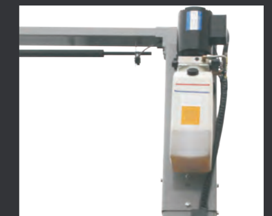
06 液压站顶置, 增大操作空间, 减少噪音。