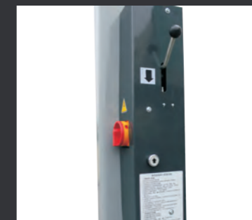
05 电气控制, 单手操作上升, 下降, 操作更方便。