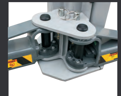
03 工作时摇臂会自动锁止, 下降到最低时会自动解锁。