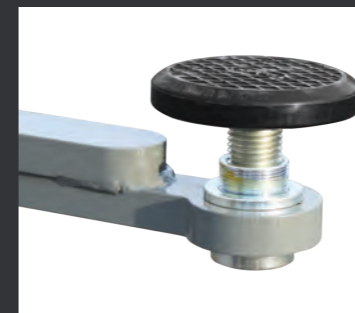
01 摇臂托垫采用三节伸缩计, 使用更方便。