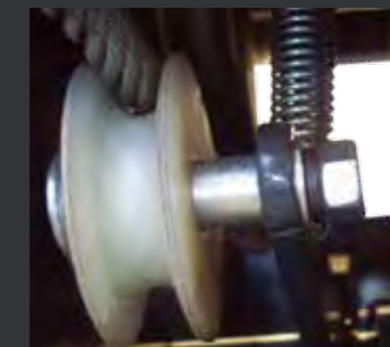
03 设置钢丝绳防断安全锁，更安全。