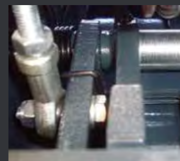
04 机械安全锁，可任意锁定在需要的高度进行作业，安全可靠。