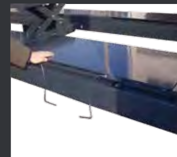
02 四轮定位之用，含一套侧滑板和一套二次举升台。