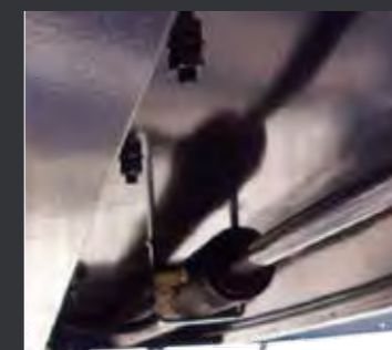
05 液压系统设置节流阀，避免了万一油管爆裂时产生的危险。