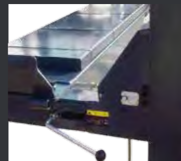
01 桥板在锁定位置可以调整，满足精确的四轮定位需要。